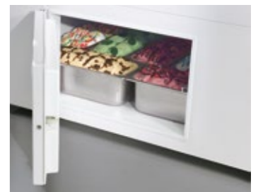
Storage cell Cella di riserva